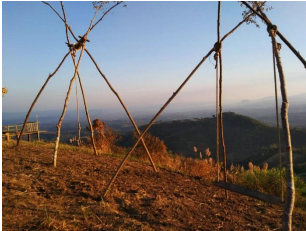
วิวที่สวยงามอีก ที่มองเห็นวิว ๓๖๐ องศา

ขยับลงมาอีกนิดจะพบแหล่งท่องเที่ยวอีกหมู่บ้าน เป็นหมู่บ้านเล็กๆ ที่ซ่อนตัวอยู่หลังภูเขาในพื้นที่ตำบลปงเตา บ้านห้วยน้ำต้น เป็นพื้นที่ของชนเผ่า อาซา ที่วิถีชีวิตที่เรียบง่าย นั่งรถลัดเลาะเข้าป่าไป จะพบจุดชม